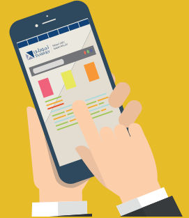
Mobile App or Telephone Account

Navigate to Saddam payment system from the main screen (The name of Saddam system may change depending on the bank)